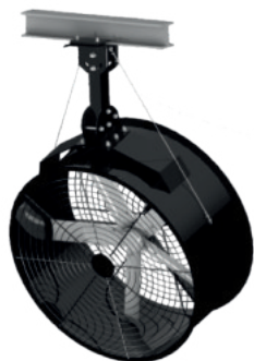
Disponible en dos diámetros